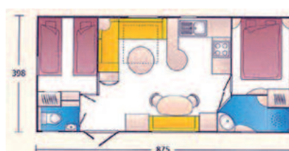
Type „Sweet Home“

HS: 87,30 / NS: 46,45 Anzahl d. Liegeplätze: 4-5 2 separate Schlafzimmer, 1 Wohnküche, WC, Dusche, Küche, TV