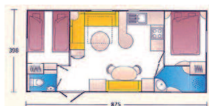
Type „Sweet Home“

HS: 91,45 / NS: 49,15 Anzahl d. Liegeplätze: 4-5 2 separate Schlafzimmer, 1 Wohnküche, WC, Dusche, Küche, TV